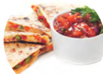
Lipie cu legume